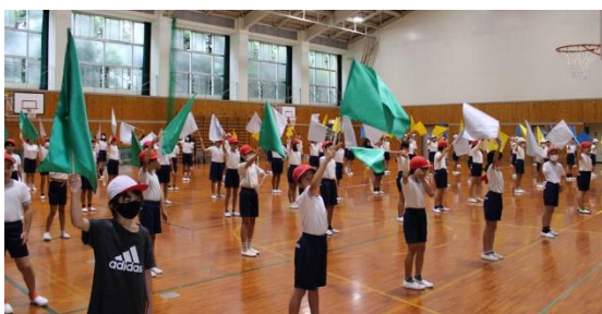
運動会練習の様子(高学年)

かが、当日の気持ちとパフォーマンスに大きく影響します。御家庭でもお子さんの様子を気にかけて、頑張りを認めたり、励ましたりしながら運動会への期待を膨らめていただきたいと思います。