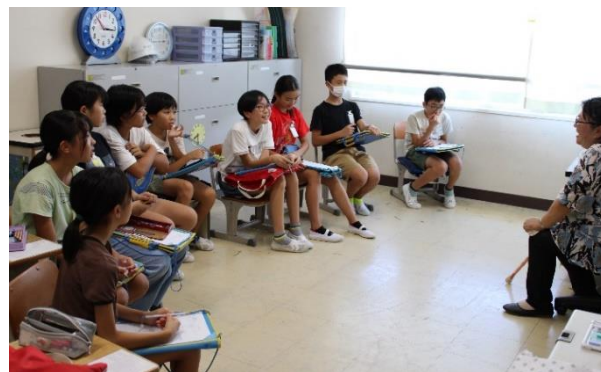
生き方講座(通訳さん)