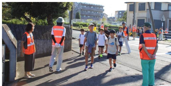
民生委員・児童委員によるあいさつ運動

10月19日(土)の運動会に向けた練習も軌道に乗ってきました。子供たちの成長には、運動会当日よりも、当日までの期間が重要だと考えています。どんな思いをもって練習や準備に取り組んできたの